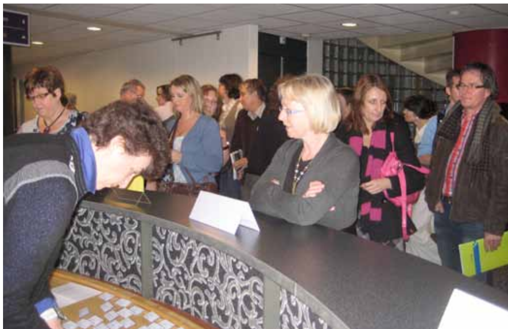
Het congres De Juiste Zet werd goed bezocht.